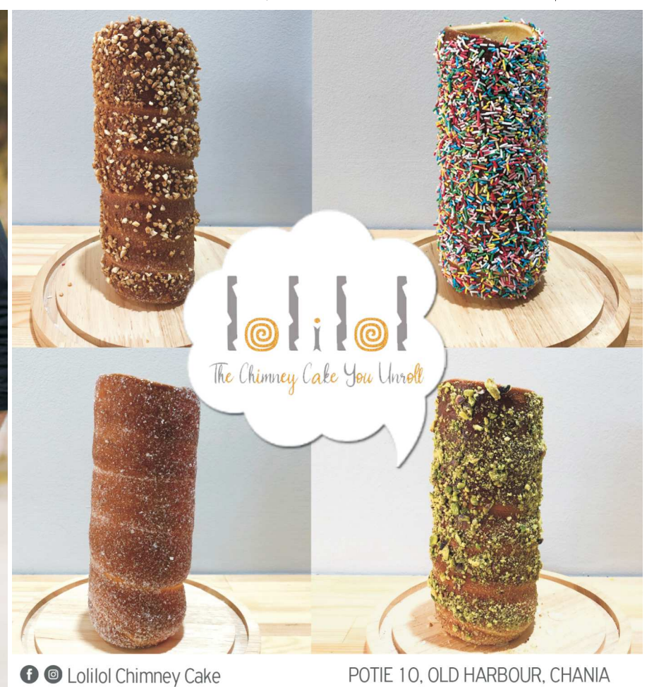
Lolilol Chimney Cake